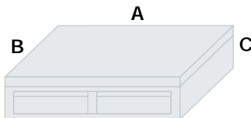
Kaffeepodest mit Sud- und Zuckerlade Abmessungen