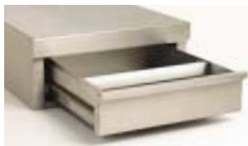
Bild oben u. rechts • Kaffeepodest in Designausführung • Kaffeepodest in Standardausführung