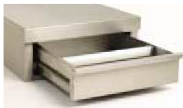
Bild oben u. rechts • Kaffeepodest in Designausführung • Kaffeepodest in Standardausführung